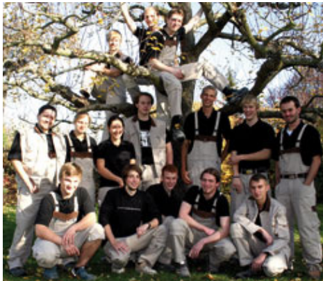
Diese 15 Jung-Gesellen durchliefen die verschiedenen Ebenen auf Innungs- und Handwerksebene, Landesebene und nahmen nun am Leistungswettbewerb auf Bundesebene in Ebern teil.

Dieser Wettkampf in Ebern fand im Rahmen des Leistungswettbewerbs des Deutschen Handwerks statt. Jedes Jahr organisieren die verschiedenen Gewerke für die Jung-Gesellen des jüngsten Abschluss-Jahrgangs diesen Wettbewerb unter dem Motto "Profis leisten was" (PLW). Zu Beginn treten die Teilnehmer am Wettbewerb auf Innungs- und Handwerkskammerebene an, dann auf Landes- und schließlich auf Bundesebene. Die Sieger kommen jeweils eine Runde weiter. Dieser Bundesvergleich gilt bei den Tischlern und Schreibern als inoffizielle Deutsche Meisterschaft. Auch in diesem Jahr unterstützten wieder verschiedene Unternehmen wie Festool, SPAX, Schorn & Groh, CWS-boco Deutschland, Häfele, Pollmeier, Leitz und Carl Goetz den Wettbewerb.